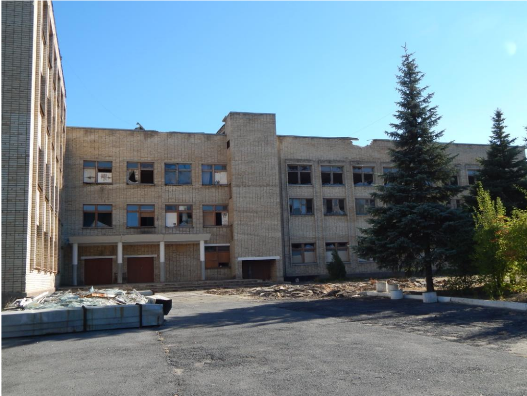
Здание школы № 1