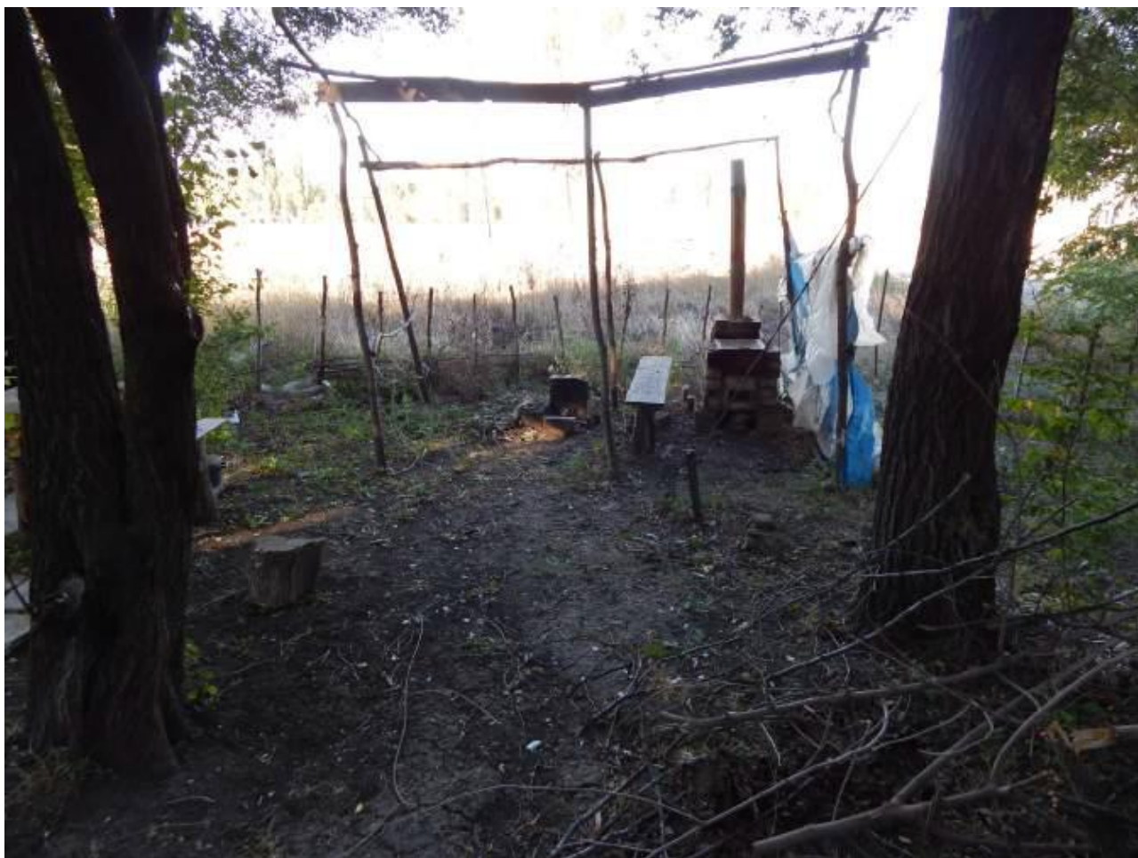
Тут жители одного из многоквартирных домов готовят себе пищу

Город значительно пострадал в ходе боевых действий. Разрушения видны везде. Создается впечатление об отсутствии в городе неповрежденных домов. Есть сложности с восстановлением. По восстановлению в городе еще работы не производились. Люди сами ремонтируют, то, что можно отремонтировать. Стройматериалы предоставляют волонтеры. Проезд в город затруднен, в городе пропускной режим. Завозить стройматериалы можно только с разрешения военного командования по специальным пропускам. Даже гуманитарную помощь – и то провозить сложно. Продукты завозят по предварительному заказу, после тщательного контроля, сверяясь с накладными. Частный бизнес вести очень сложно. Работы в городе практически нет. Воду, после 10 месяцев отсутствия, наконец, пустили, но пить ее нельзя – она «техническая». Зимой в городе не было центрального отопления – ставили буржуйки. Но уголь – большая проблема для Красногоровки. Топили печи дровами. Начали вырубать зеленые насаждения, которыми город был раньше богат. Все, с кем мы разговаривали, «боятся зимы». Необходимы газовые баллоны, уголь, дрова. А провезти их сложно, нужен пропуск.