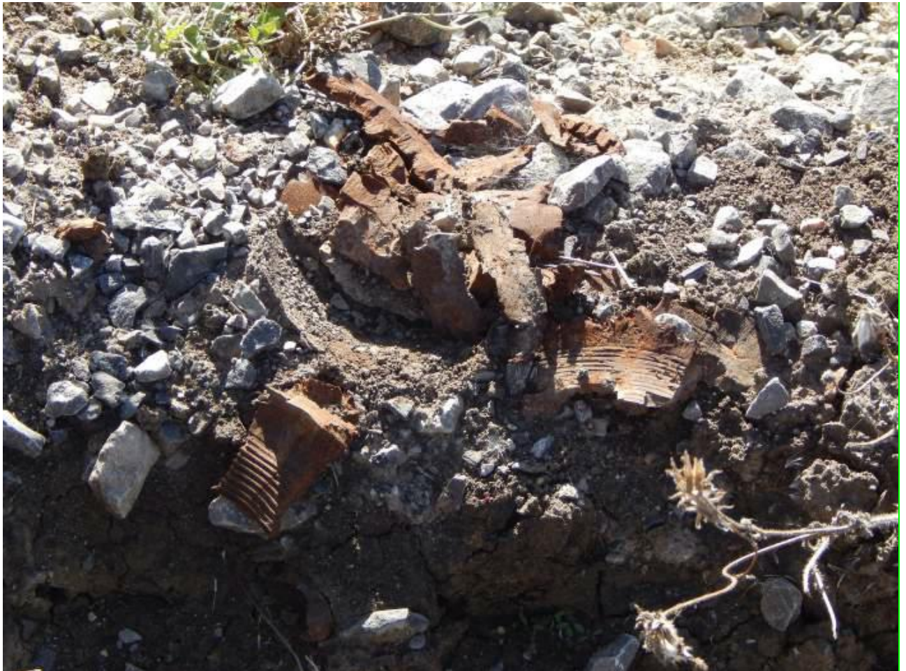
Рядом со зданием школы № 1