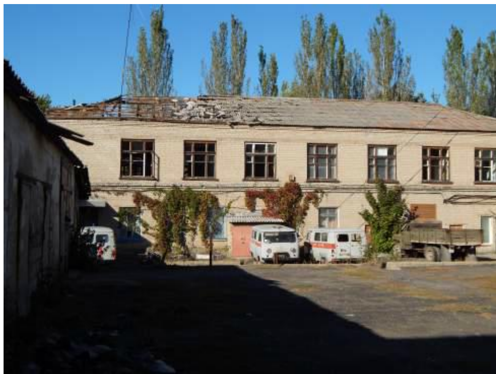
Больница в Красногоровке, последствия обстрелов.