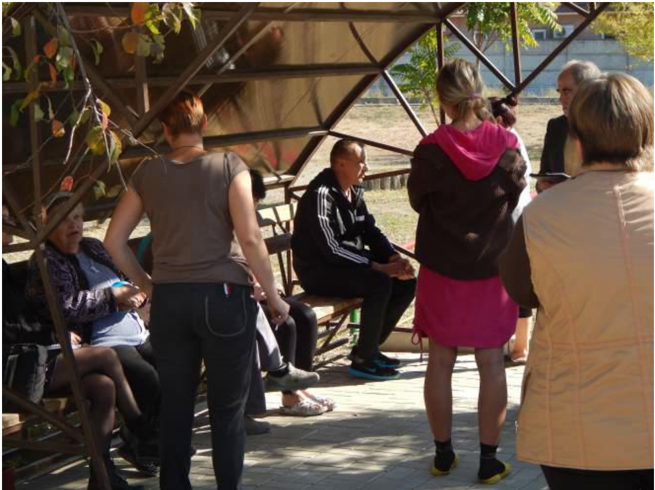
Святогорск. Во время встречи с временно перемещенными лицами