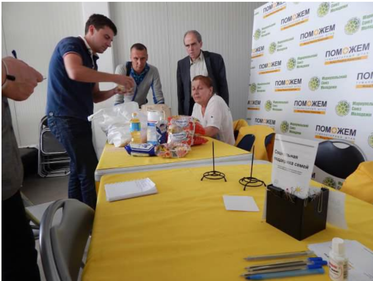
В логистическом центре Фонда Рината Ахметова в Мариуполе

В колонне обычно – 25 тыс. продуктовых пакетов. Колонны, как правило, приходят 2 раза в месяц. Всего было 28 колонн.