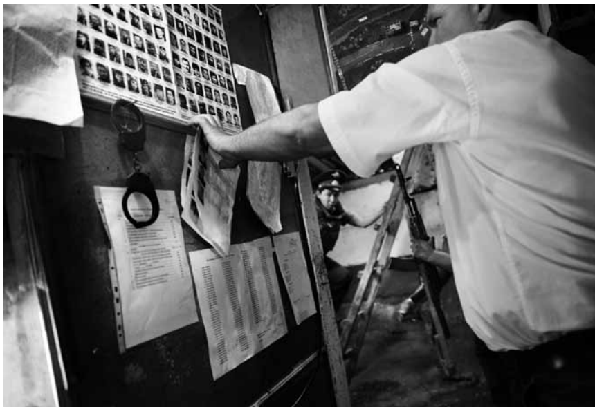
В Карабудахкентском РОВД.