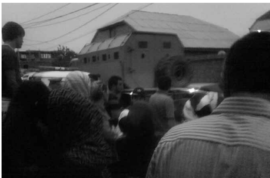
Махачкала, улица Юбилейная, ночь с 18 на 19 мая 2012 года. Дом, в котором предположительно находится террорист блокирован силовиками. Люди, обеспокоенные тем, что руководители спецоперации не выпускают из блокированного дома женщин и детей, собрались за оцеплением (см. раздел P.S. доклада стр. ....).