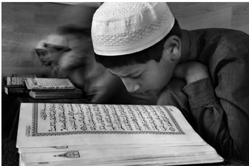
Махачкала. В медресе.