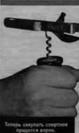
Теперь заплывать спиртное придется впрямь.