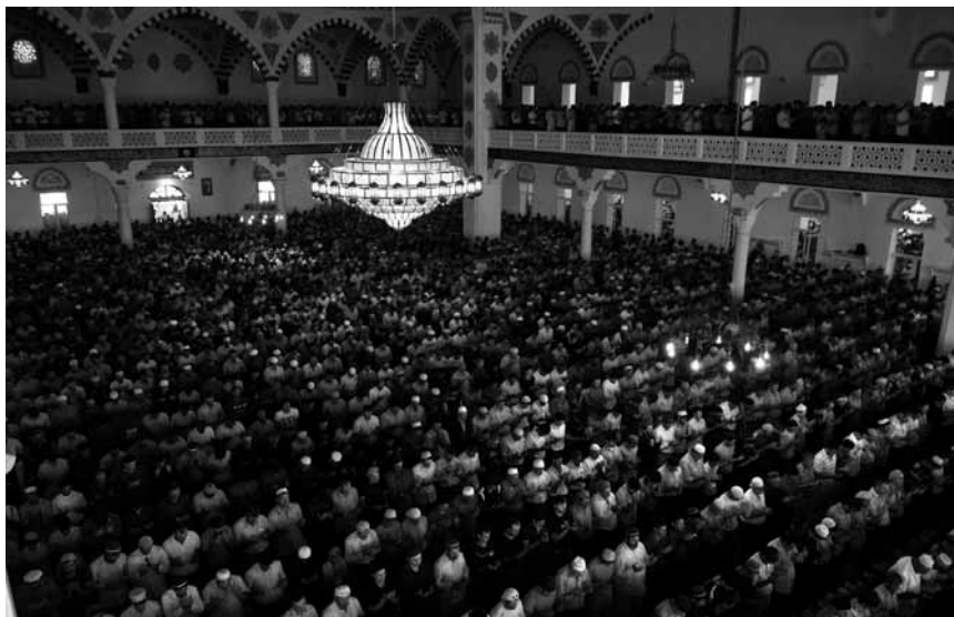
Махачкала, Джума мечеть. Пятничная молитва.