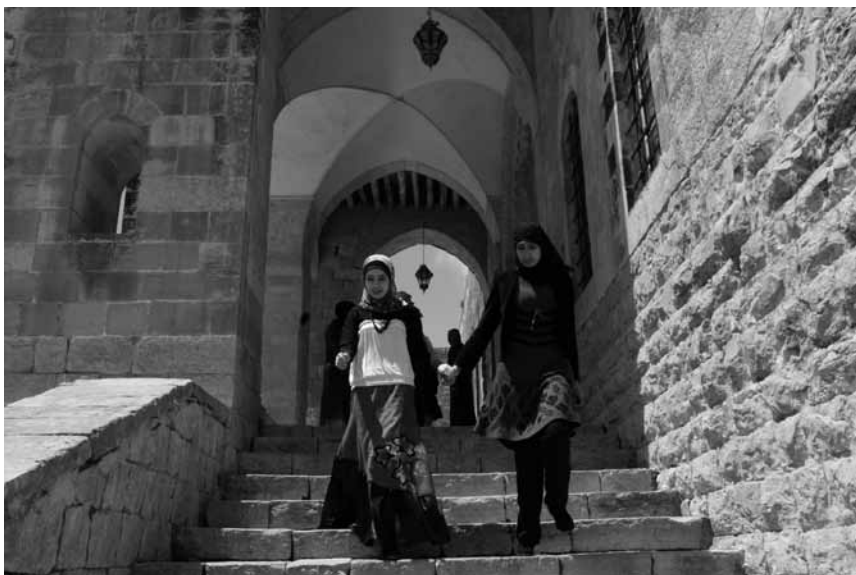
Махачкала. В женском медресе.