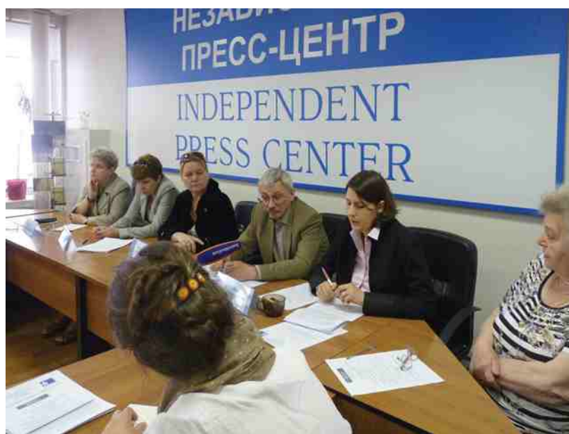
Пресс-конференция «Кто срываёт мирный процесс в Дагестане?». Независимый пресс-центр, Москва, 25 мая 2012г.